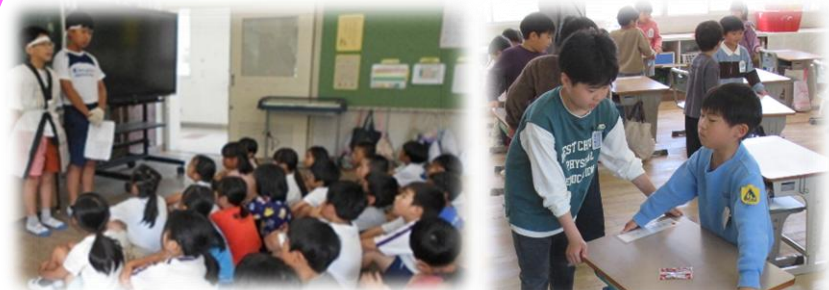
運動会前の応援団の練習