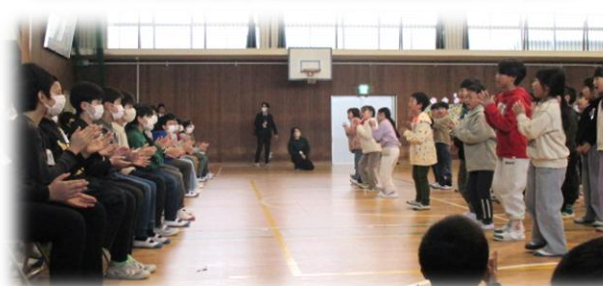
全ての演技に心を込めて拍手してくれた6年生