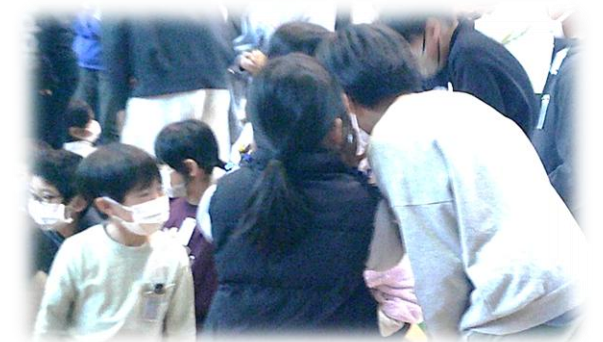
スマイルグループ対抗「伝言ゲーム！」 耳打ちで、1年生から6年生まで伝えます。