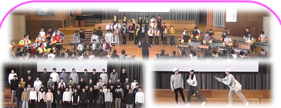
堂々とした姿、やり抜く素晴らしさを見せてくれた6年生。みんなの憧れでした。