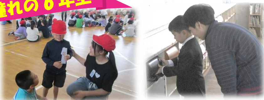
スマイルグループでの活動。いつも下級生を優しく導いてくれました。頼りになる優しい6年生でした。