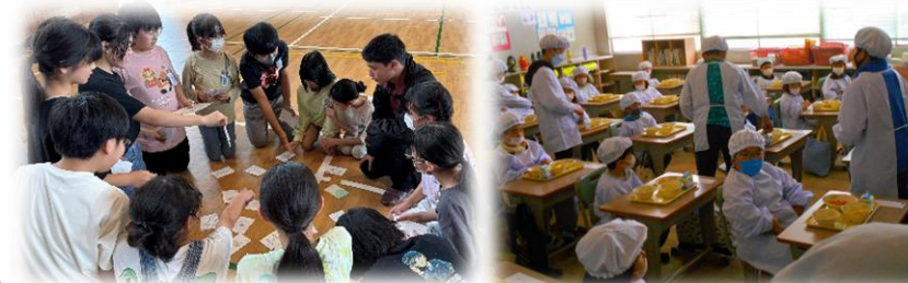
メリノール高校との交流