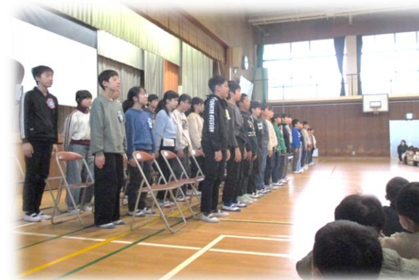
感動の歌声と言葉。6年生の発表にみんな釘付けでした。