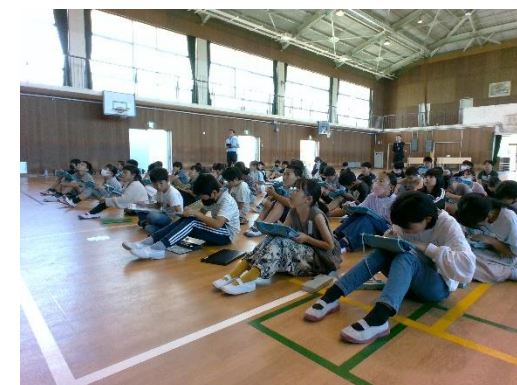
裏に「お知らせとお願い」があります。