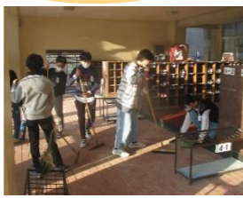
▲栽培・美化委員会