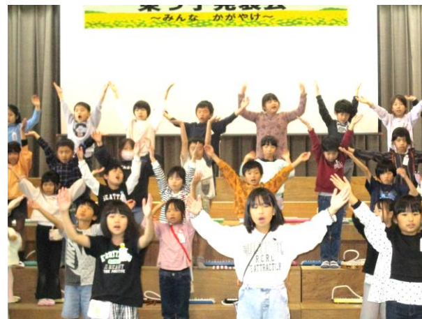
世界の歌のリズムに合わせて、動きを工夫しました。