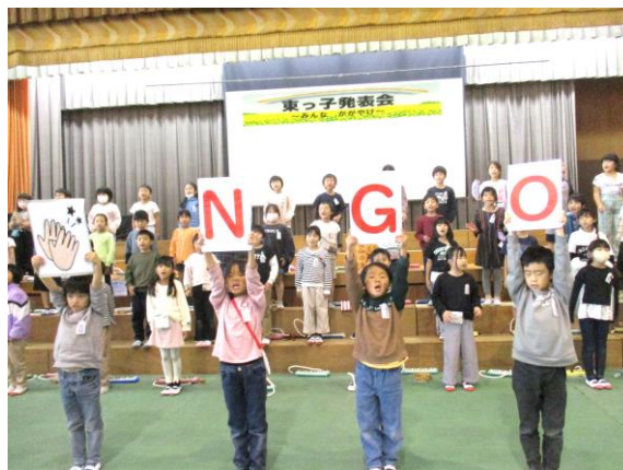
いろいろな国の歌を、楽しく元気よく歌って表現しました。