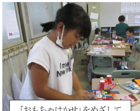
「おもちゃはかせ」をめざして、よく動くひみつを発見するぞ！