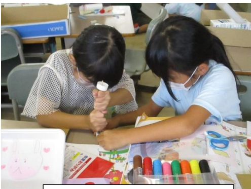
グループで、工夫したことを教え合おう！

そのため、これからも製作の途中で追加の材料が必要となりますが、その都度持ってくるように続けて準備をよろしくお願いいたします。