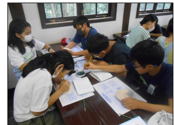
有田焼絵付け体験。焼き上がりは1か月後、楽しみです!