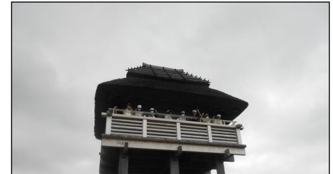
吉野ヶ里遺跡公園では、高床倉庫に入ったり物見やぐらに上ったりしました。弥生人気分を満喫です!!