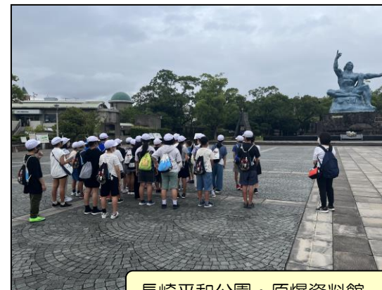
長崎平和公園・原爆資料館。平和の大切さを改めて感じました。