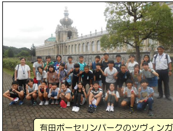
有田ポーセリンパークのツヴィンガー宮殿で集合写真を撮りました。