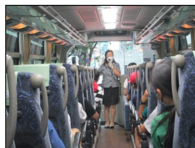
新幹線に乗って福岡県へ行きました。 バスに乗って吉野ヶ里遺跡へ出発です!!