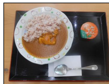
吉野ヶ里遺跡公園で食べた カレーです!!