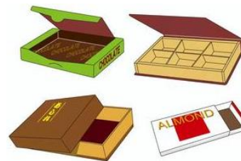
お菓子などの空き箱